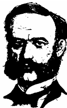
赤十字の創始者 アンリー・デュナン (第1回ノーベル平和賞受賞)